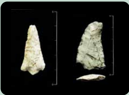
Punte di freccia rinvenute nel sito dell'Omo de la roccia

Una manciata di monete romane rivela che la zona era conosciuta anche nel IV-V secolo d.C. e ci sono prove di utilizzo dell'area di Pelade, immediatamente a monte del monolite, tra il X e XI secolo d.C., in periodo alto-medievale. Probabilmente la posizione era favorevole allo sfruttamento di risorse del bosco e del pascolo, le quali hanno permesso nel XIV-XVI secolo d.C. di rinvenire tracce di frequentazione del Buso delle Anguane.